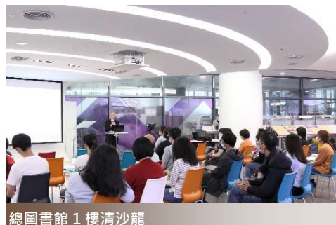
總圖書館 1 樓清沙龍