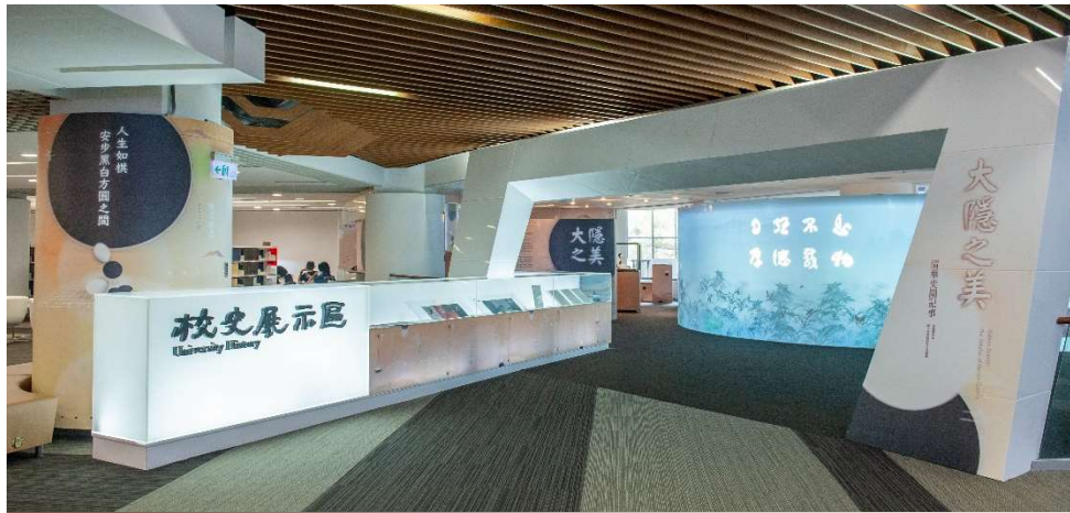
總圖書館 2 樓校史展示區