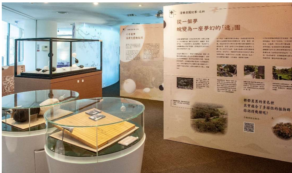
總圖書館 2 樓校史展示區