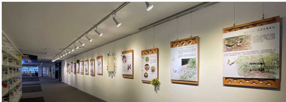
總圖書館 4 樓清華故事牆